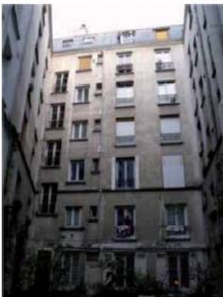
Cour côté 11 rue de Panama