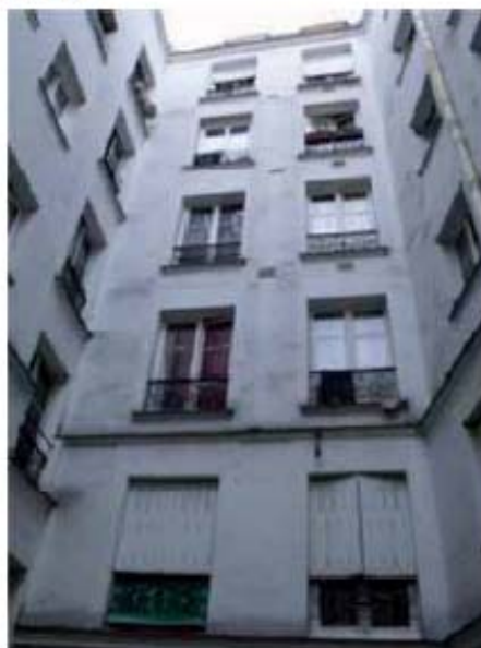
Cour côté 9 rue de Panama